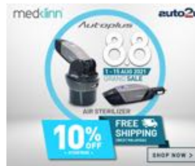
( https://bit.ly/c1-auto2u-medklinn-88sa )