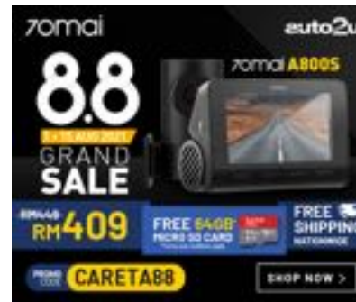
( https://bit.ly/c2-auto2u-70mai-88sale )