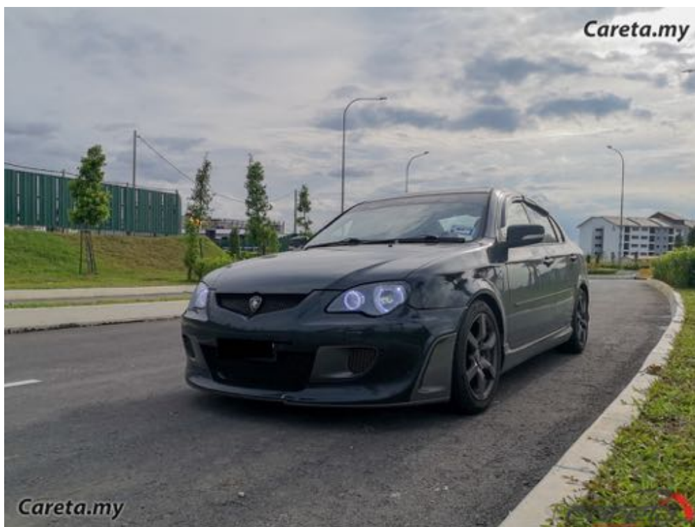
( https://careta.my/sites/default/files/styles/watermark/public/2021-07/Careta%20Persona%20R3%202021.jpg?itok=9gX3zd1k )

INFORMASI (/CATEGORIES/INFORMASI) OLEH MOHAMAD HANIF | 23-07-2021