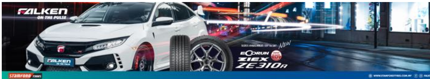
( https://www.stamfordtyres.com.my )