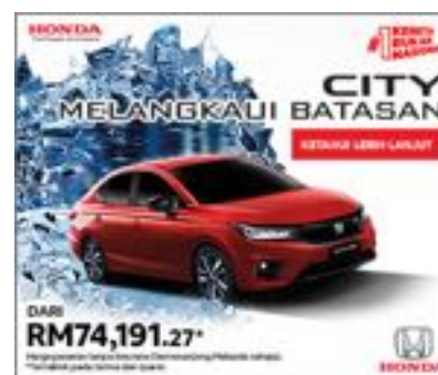
( https://www.honda.com.my/model/ciutm_source=Careta&utm_medium=Display%20Aug_Aug_300x250_V1_MSD_MREC_D )