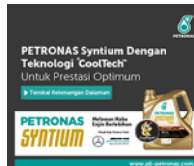
( http://www.pli-petronas.com )